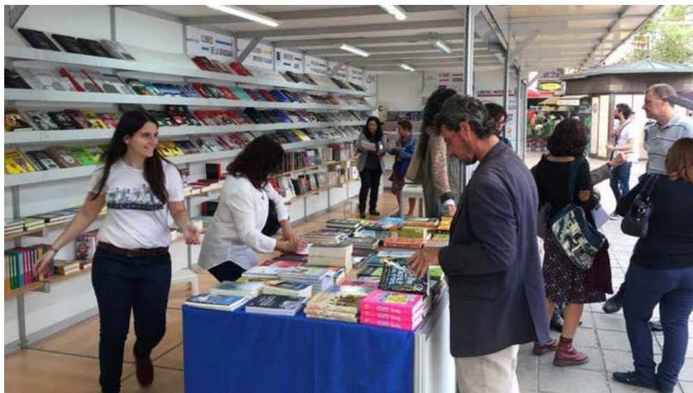
Una imatge de la Plaça del Llibre del 2016.

Al començament de novembre (del dia 1 al 5 enguany) els llibres ocupen la plaça de l'Ajuntament, a València. És la festa major del llibre en valencià. Els llibres escrits, editats i llegits són com el termòmetre d'una cultura. La Plaça del Llibre és una gran iniciativa dels professionals del sector, els editors, els llibreters, amb la participació activa dels autors i del públic lector. Amb el concurs de les institucions, com és normal i lògic. Els llibres són un gran invent, una eina de difusió del coneixement i una font de plaer (el plaer de llegir) sense parió. Tenen mala peça al teler en l'era d'Internet? Amençats pel llibre electrònic i els nous formats? Potser sí, qui ho sap. Però una cosa és clara: la Fira del Llibre de Frankfurt, el gran aparador mundial de la indústria del llibre, funciona a tot gas. El llibre en paper és un invent tan arrodonit com l'ampolla de vidre o la cadira per asseure's. Té molts problemes, és cert, però la seua simplicitat i utilitat comprovada li asseguren molt anys de vida.