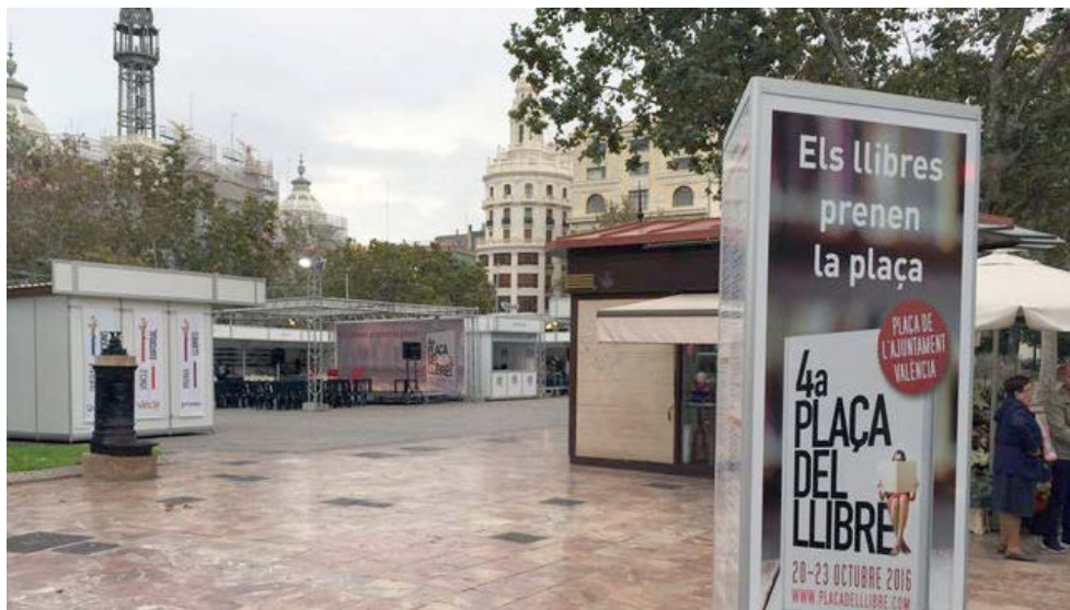
Plaça del Llibre.

Plaça del Llibre, és ja un poeta de referència amb una gran projecció. Una poesia reveladora, compromesa, de molts registres. I també un autor estimat.