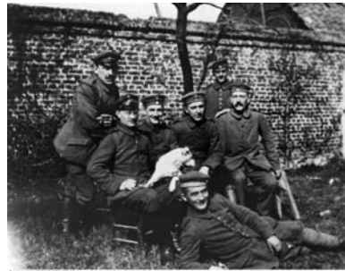
Soldados alemanes en la Gran Guerra, entre ellos un joven Adolf Hitler

Según Traverso durante la guerra civil se alcanza la anomia , es decir la incapacidad de la estructura social de dar respuesta a parte de sus individuos que se ven incapaces de cumplir su función social, este término es clave para entender el surgimiento del fascismo, que a su vez es pieza indispensable en la guerra civil europea.