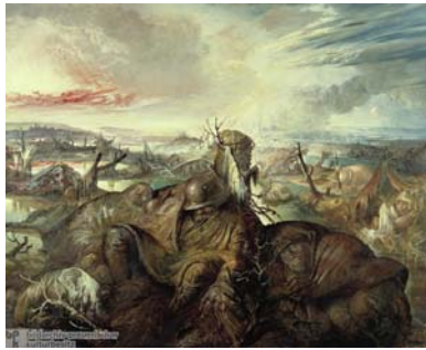
La primera guerra mundial por Otto Dix

culturales de cineastas, literatos, pintores o poetas de todo signo político.