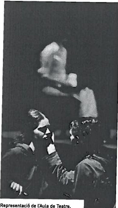
Representació de l'Aula de Teatre.

El Centre de les Arts de la UAB presenta la seva programació acadèmica per al curs 2003-2004. Cultura en Viu, conjuntament amb diferents centres de la UAB, ofereix un programa de formació artística que l'alumne pot integrar en el seu currículum acadèmic. Per als estudiants ofereix les Mencions en Teoria i Pràctica de la Creació Teatral i en Teoria de les Arts. Pel que fa a la formació continuada, organitzen el Màster de Dansa Moviment Teràpia, amb la col·laboració del Departament de Psicologia de la Salut i de Psicologia Social i el suport de l'Institut del Teatre; i Pensar l'Art d'Avui, cinquena edició del postgrau d'Estètica i Teoria de l'Art Contemporani, organitzat amb el Departament de Filosofia i la col·laboració de la Fundació Joan Miró. Organitza també diversos cursos i tallers, tant d'iniciació com de creació artística. Els cursos -de 24 a 180 hores- són convalidables per crèdits de lliure elecció. El període d'inscripció es va iniciar el 15 de setembre.