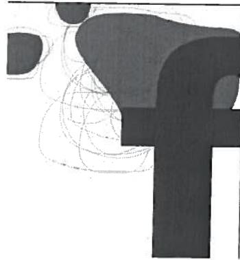
Imatge gràfica de la campanya.

► La UAB preveu que desapareguin els fums de tots els seus edificis abans de finalitzar el curs acadèmic 2003-2004.