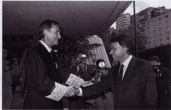
FRANCISCO TOMÁS Y VALIENTE RECIBE AL PRESIDENTE DEL GOBIERNO, FELIPE GONZÁLEZ, QUIEN ASISTIRÁ AL ACTO CONMEMORATIVO DEL SEXTO ANIVERSARIO DEL TRIBUNAL CONSTITUCIONAL

actuaron en el marco de toda una generación”, declara el comisario, destacando la capacidad que tuvieron los protagonistas de construir un futuro no excluyente, reivindicando el papel de la transición en la actualidad. “Hay que seguir destacando las cosas buenas de la Constitución del 78, tiene que estar permanentemente abierta, igual que los legisladores. Hay que pasar a un enriquecimiento de la democracia aprovechando el descontento y las críticas de los ciudadanos. El diálogo y la denuncia no es la solución a los problemas, pero es un aspecto importante para encontrar el camino” , añadió el comisario durante la presentación de la muestra.