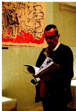
LA OBRA GOZA DE GRAN INTERÉS, PARA ILUSTRAR A LAS NUEVAS GENERACIONES EN LAS DIFICULTADES DE LA TRANSICIÓN