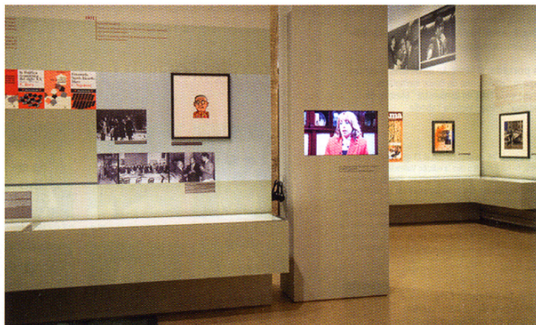
UN VÍDEO RECOPILA ENTREVISTAS A 35 PERSONAS PARA DOCUMENTAR LA EXPOSICIÓN DISPONIBLES TAMBIÉN EN LA PÁGINA WEB DE LA UV

fesores, entrevistas, noticias, portadas alusivas a sus personas, caricaturas, etc. También se incluyen algunos de sus libros y artículos, fotografías así como objetos personales: las gafas de Manuel Broseta o la cartera de Ministro de Sanidad, de Ernest Lluch. “ El material plasma que estos tres personajes