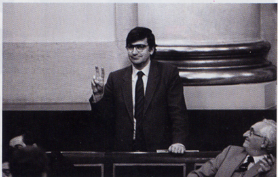
EL MINISTRO DE SANIDAD HACE LA SEÑAL DE LA VICTORIA DURANTE EL DEBATE DE LA APROBACIÓN DEL PROYECTO DE LA LEY DE SANIDAD EN EL AÑO 86