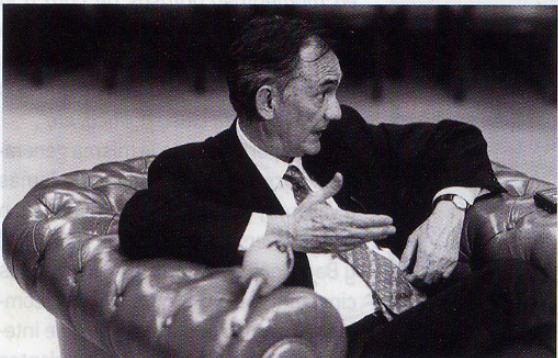
EL EXPRESIDENTE DEL TRIBUNAL CONSTITUCIONAL DURANTE LA RUEDA DE PREGUNTAS POSTERIOR A LA CONFERENCIA “LAS LEYES FUNDAMENTALES Y LA CONSTITUCIÓN DE 1812”