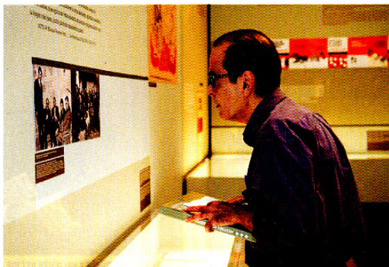
LA EXPOSICIÓN DESPIERTA LA MEMORIA GENERACIONAL