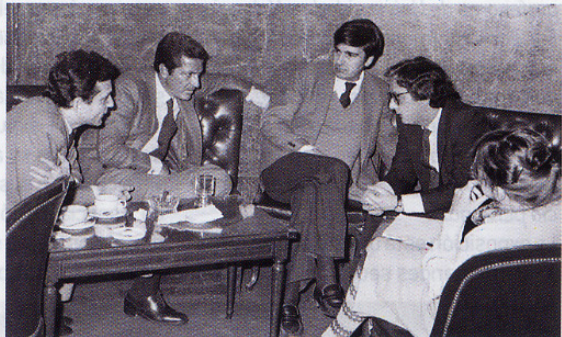
ERNEST LLUCH CON ADOLFO SUÁREZ, BENEGAS Y OTROS POLÍTICOS DE LA TRANSICIÓN