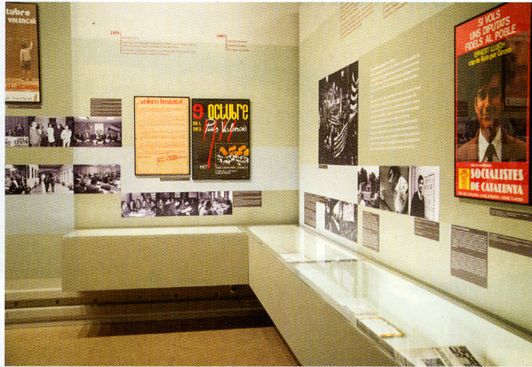
LA MUESTRA RECOGE MATERIAL DOCUMENTAL Y PERSONAL DE LOS PROTAGONISTAS Y SU PAPEL EN LA TRANSICIÓN

Otro rasgo común de los tres es que, como óptimos profesores jóvenes del momento, creyeron en la utilidad de las ciencias sociales para ayudar a cambiar la vida. Fueron demócratas y la dictadura los tenía por subversivos, pero sobre todo fueron competentes. Los tres tuvieron una honda vocación universitaria, que es vocación intelectual de investigación, lecturas, buena docencia y dirección de trabajos; los tres cuando cesaron en política volvie-