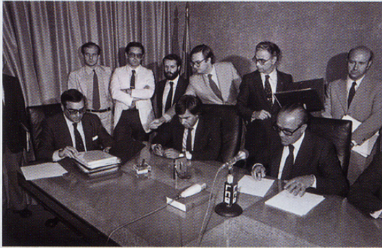
EL PRESIDENTE DEL GOBIERNO, LEOPOLDO CALVO SOTELO, Y EL SECRETARIO GENERAL DEL PSOE, FELIPE GONZÁLEZ, FIRMAN LOS DOCUMENTOS DEL PACTO AUTONÓMICO EN PRESENCIA DEL MINISTRO DE ADMINISTRACIÓN TERRITORIAL > Foto RODOLFO MARTÍN VILLA