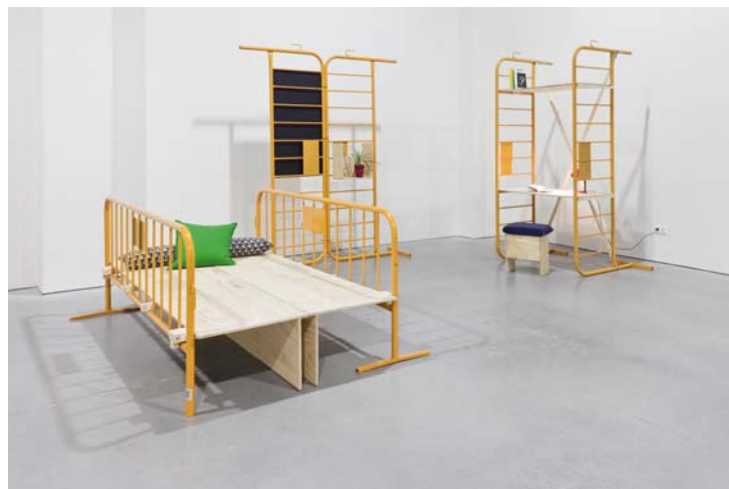
Kit de autogestión vecinal Almáciga , del estudio Cenlitrosmetrocuadrado, que forma parte de FSWD.

APTO PARA: Aficionados a pensar el arte como modo de dar sentido al mundo (o, como en este caso, quitárselo). NO APTO PARA: Quienes le tengan fobia al pensamiento articulado y las ideas elevadas.