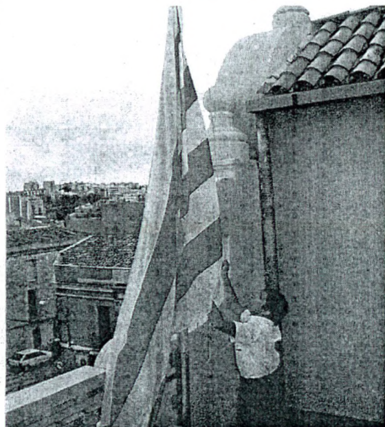
Els autors insisteixen en la unitat nacional per la futur pròxim.

Mai no és fàcil ser la segona part de... I més, si es tracta de superar, o com a mínim, aconseguir mantindre l'èxit de l'antecessor. I això és el que passa amb el segon volum de la trilogia «País Valencià. Segle XXI. Noves reflexions crítiques». La qualitat de les reflexions aportades en el primer volum, que tantes adhesions i crítiques ha rebut, deixava el llistó molt alt per als qui han acceptat en aquesta ocasió plasmar els seus pensaments sobre el futur polític del territori. I això és nota. Els autors estan condicionats pels escrits anteriors i, potser per això, moltes de les actuals aportacions redunden sobre temes a bastament tractats, com la destrucció del territori, la persecució de la llengua, l'enfonsament d'un model econòmic amb incidència especial en les estructures econòmiques valencianes, la necessitat