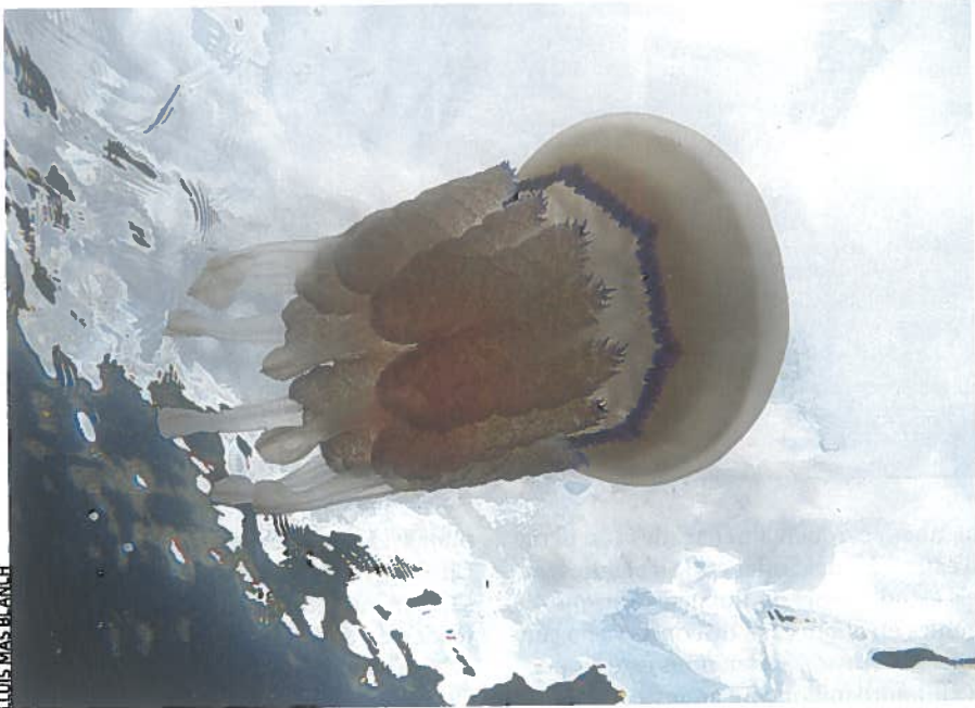
ILLUSTRACIÓ DE LLUIS MAS BLANCH

L'increment de la temperatura del mar pot brindar una oportunitat a espècies termòfiles que produeixen compostos amb potencial bioactiu. És el cas de meduses com Rhizostoma pulmo amb potencial bioactiu citotòxic.