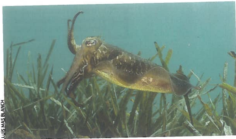
LUIS MAS BLANCH

Hi ha diverses bioactives a la mar Mediterrània. És el cas de mol·luscs com la sípia ( Sepia officinalis ), amb potencial antibacterià (a l'esquerra), o d'equinoderms com l'eriç de mar ( Paracentrotus lividus ) amb potencial antiinflamatori (a la dreta).