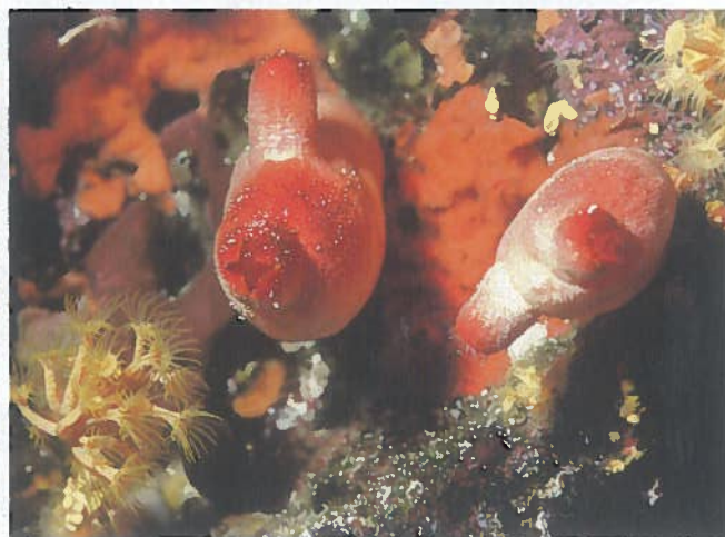
per a nous medicaments. La majoria d'aquestes espècies bioactives són organismes sèssils bentònics com els de les imatges. D'esquerra a dreta, el cnidari Actinia equina , amb potencial antiinflamatori, l'esponja Axinella damicornis , amb potencial antibacterià o el tunicat Halocynthia papillosa , amb potencial antitumoral.