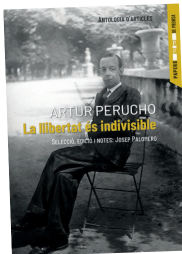
«La llibertat és indivisible».

El tercer bloc, que conté vint articles, titulat «Internacional», tracta de mostres en què descri-