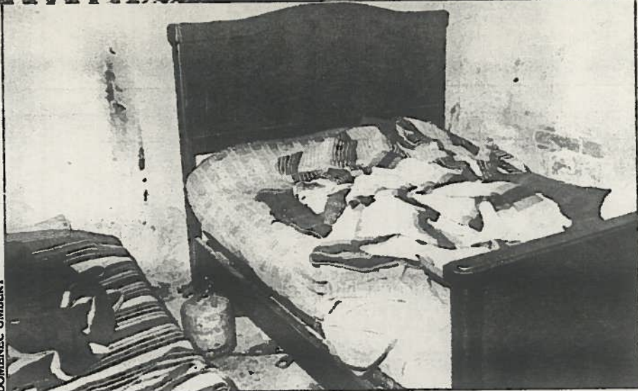
Habitatge usual dels africans a Tèrmens.