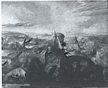
La primera guerra mundial por Otto Dix

culturales de cineastas, literatos, pintores o poetas de todo signo político.