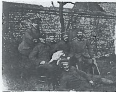
Soldados alemanes en la Gran Guerra, entre ellos un joven Adolf Hitler

Según Traverso durante la guerra civil se alcanza la anomia , es decir la incapacidad de la estructura social de dar respuesta a parte de sus individuos que se ven incapaces de cumplir su función social, este término es clave para entender el surgimiento del fascismo, que a su vez es pieza indispensable en la guerra civil europea.