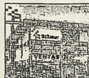
Nuestra oficina de Información y ventas en Valterna