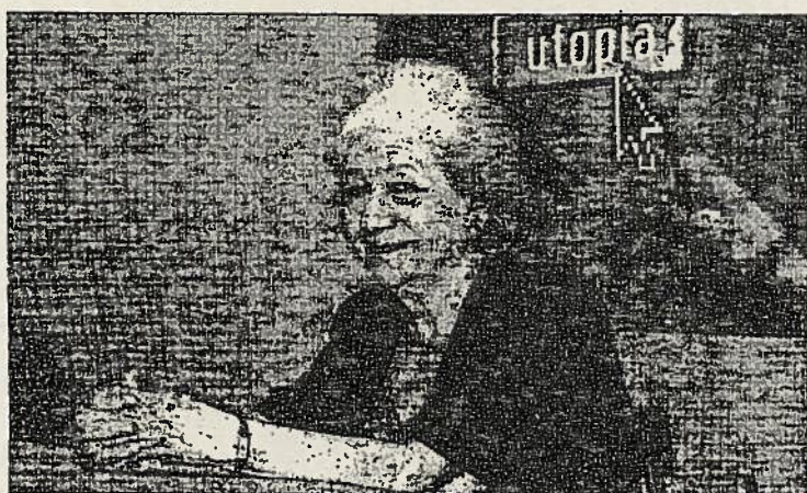
Libros mágicos. Ana María Matute sostiene que escribe libros mágicos porque la vida es mágica. "Nací con la magia y me di cuenta que era escritora el día que me castigaron en un cuarto oscuro y disfruté viendo siluetas e imaginando historias", cuenta.

La académica y escritora Ana María Matute asistió ayer al congreso internacional "¿El retorno de la utopía?" donde se confesó desesperanzada del mundo actual, debido a su mercantilización y del comportamiento de los hombres a los que les faltan valores humanísticos. "No estoy orgullosa de pertenecer a la especie humana", afirmó. Sin embargo, mantiene su esperanza, ya que "el ser humano sigue teniendo sed de sueños, y eso hace que la vida sea mágica, y la magia pertenece a la realidad".