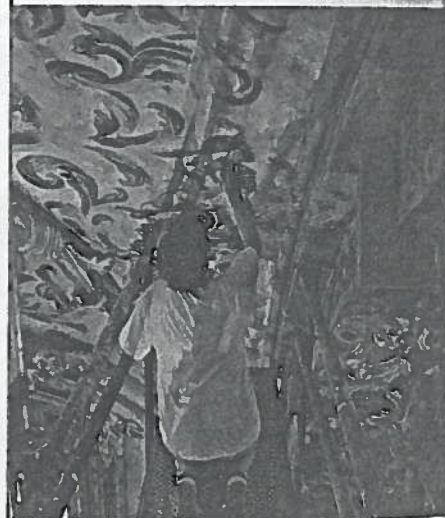
Trabajos de restauración realizados en el Monasterio de La Valldigna.