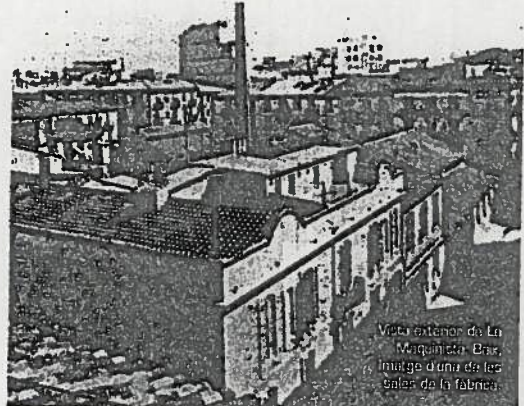
Vista anterior de La Maquinista. És imatge d'una de les sales de la fàbrica.