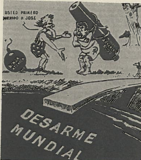
Imagen publicada en el «New York Herald Tribune» ridiculizando la actitud de los gobiernos ante la posibilidad de un desarme bilateral.

se hicieron de los grandes condicionantes políticos de sus vidas; representaciones que, vale decir, tienen una lógica relativamente independiente de lo que aconteció en el mundo que pretendían representar.»