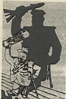
«El humorista», de Emmwood, en «The Sunday Dispatch».

fueron desintegrando del bloque y eligieron democráticamente a sus gobernantes. Poco después, lo que había sido el Imperio ruso, y después de la revolución bolchevique, la URSS, también se desintegró, llenando su vacío la Comunidad de Estados Independientes. Toda la estructura geopolítica soviética construida desde 1945 había desaparecido con el recogimiento de Rusia sobre sí misma. La arquitectura política de la guerra fría había desaparecido. Sin escenario ya no podría representarse, pero quedó pendiente una de sus más amenazadoras consecuencias: los arsenales con armas estratégicas».