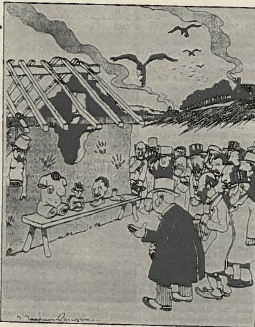
«Atrocidades en los Balcanes», de J. Jacques Rousseau, en «Le Charivari», 1913