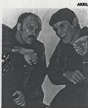
La parella còmica Faemino y Cansado.

Faemino y Cansado segueixen amb els personatges de sempre en un espectacle fet a mida dels amants de l'humor surrealista i dels fidels seguidors del duet humorista: