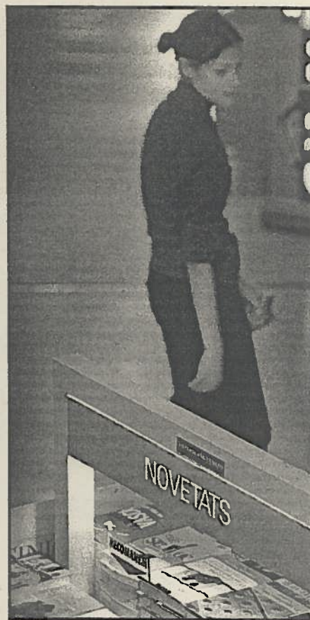
El repàs de l'any resulta emfotjament breu.

Un amic em suggeria la possibilitat que Un país amb futur (Afers), el llibre de converses amb Pere Mayor recollides per Victor G. Labrado, pogués ser considerat com un assaig. No ho crec. Es tracta d'unes memòries inequívocament polítiques, amb totes les