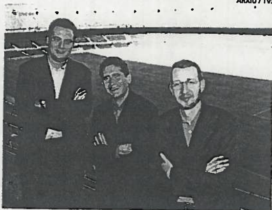
TV3 s'afegeix aquesta tardor al centenari del Barça amb el programa 'Aquest any, cent!'.