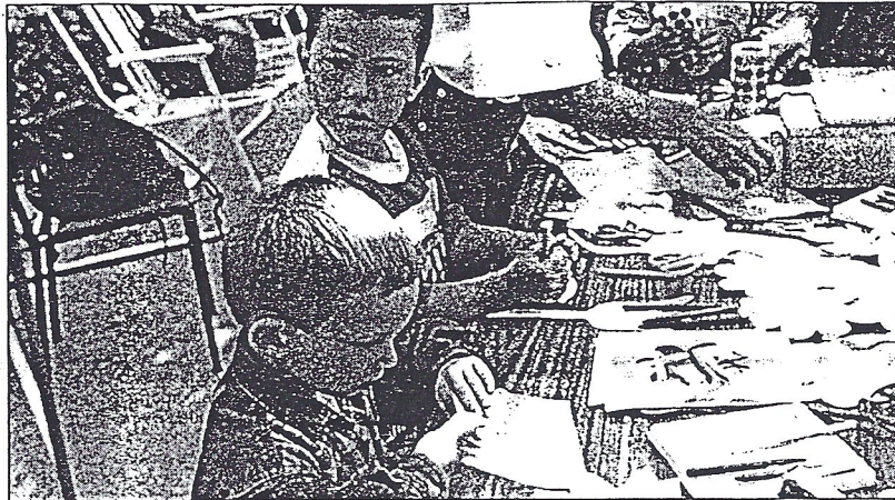
El estudio da prioridad a los hijos de parejas que trabajan.

En la propuesta presentada en la tesis, las familias en las que sólo trabaja el padre o la madre y el pequeño tiene menos de dos años no deberían recibir ayudas a la educación infantil, ya que uno de los dos progenitores puede hacerse cargo de la guarda del bebé. Sin embargo, en las parejas que tienen un niño de esta edad y ambos miembros trabajan, señala dos opciones posibles en