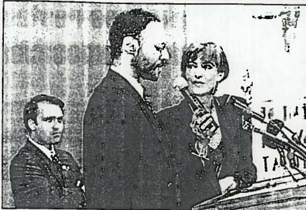
Llibres de les obres guanyadores de l'any passat. A la dreta els autors premiats.