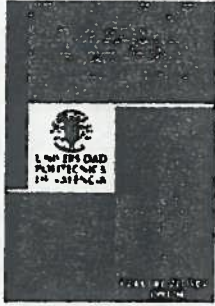
La guía en libro.