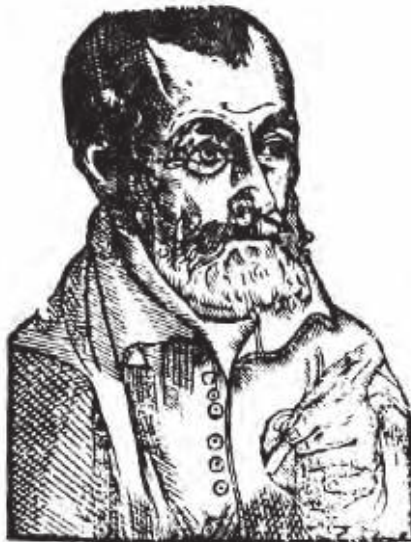
Etatisque auctoris anno 63