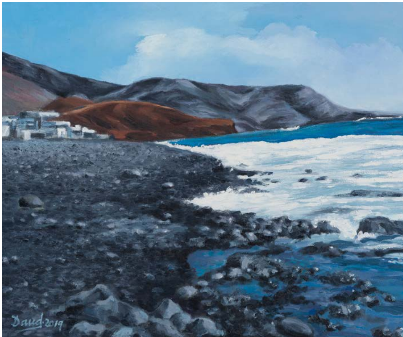
Playa Quemada, 2019 · Oli/tela Óleo/tela · 46 x 55 cm